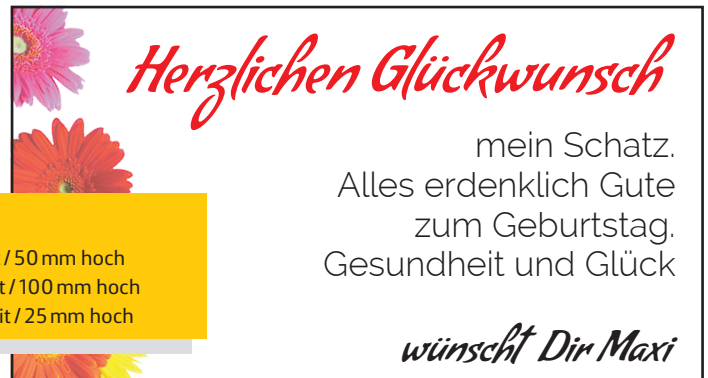
Abbildung zeigt Muster 1 a)