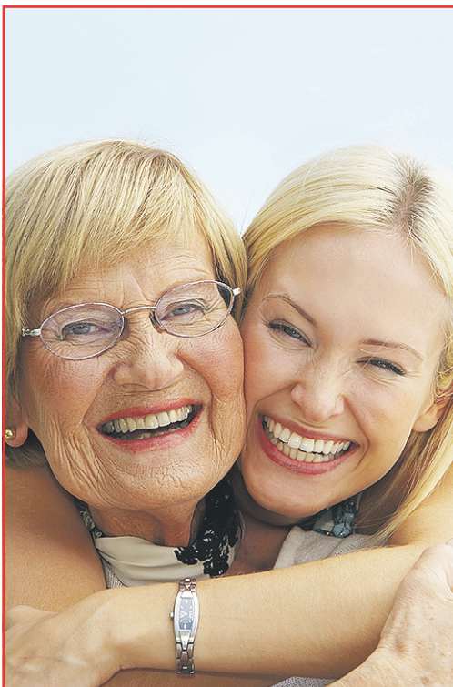
Abbildung zeigt Muster 3 a)