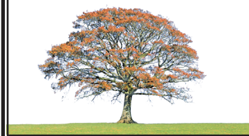
Abbildung zeigt Muster A b)

Die Trauerfeier findet statt am Freitag, dem 00. Monat 0000 um 00.00 Uhr, in der Pfarrkirche, Musterstadt, Musterstraße.