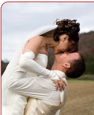
Abbildung zeigt Muster 2 a)